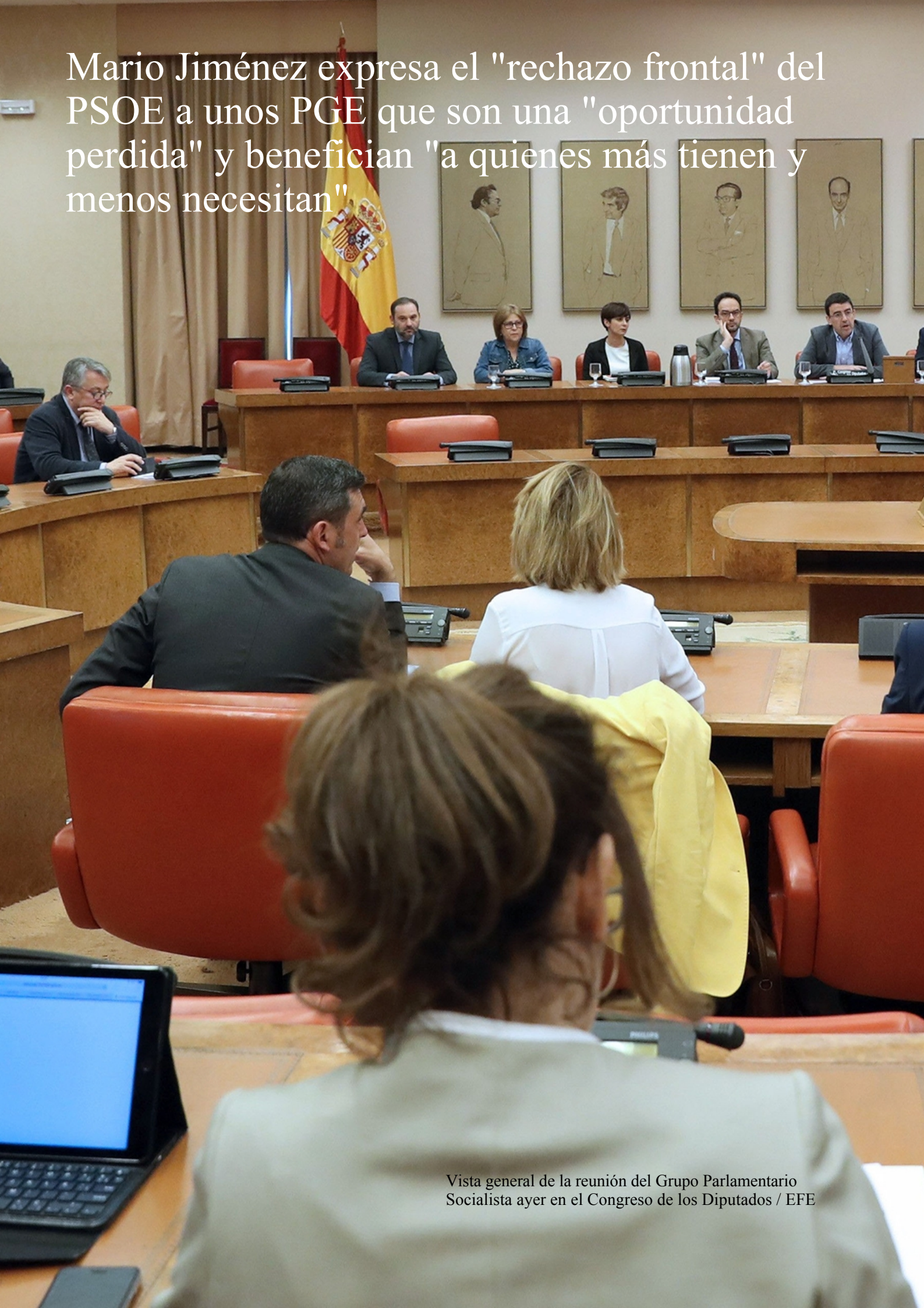
Vista general de la reunión del Grupo Parlamentario Socialista ayer en el Congreso de los Diputados