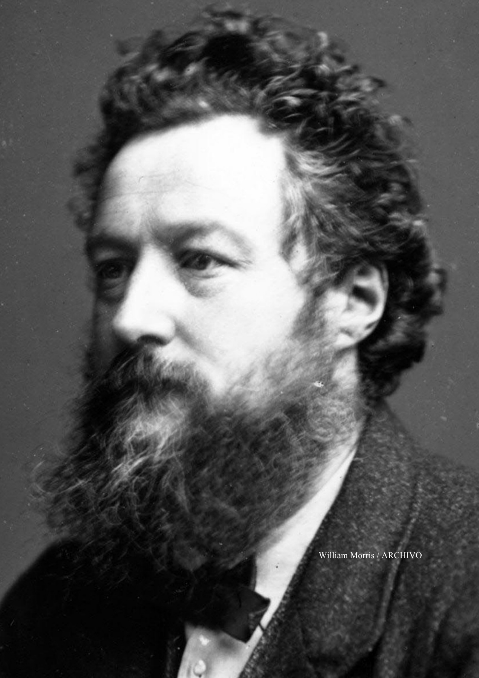
William Morris / ARCHIVO